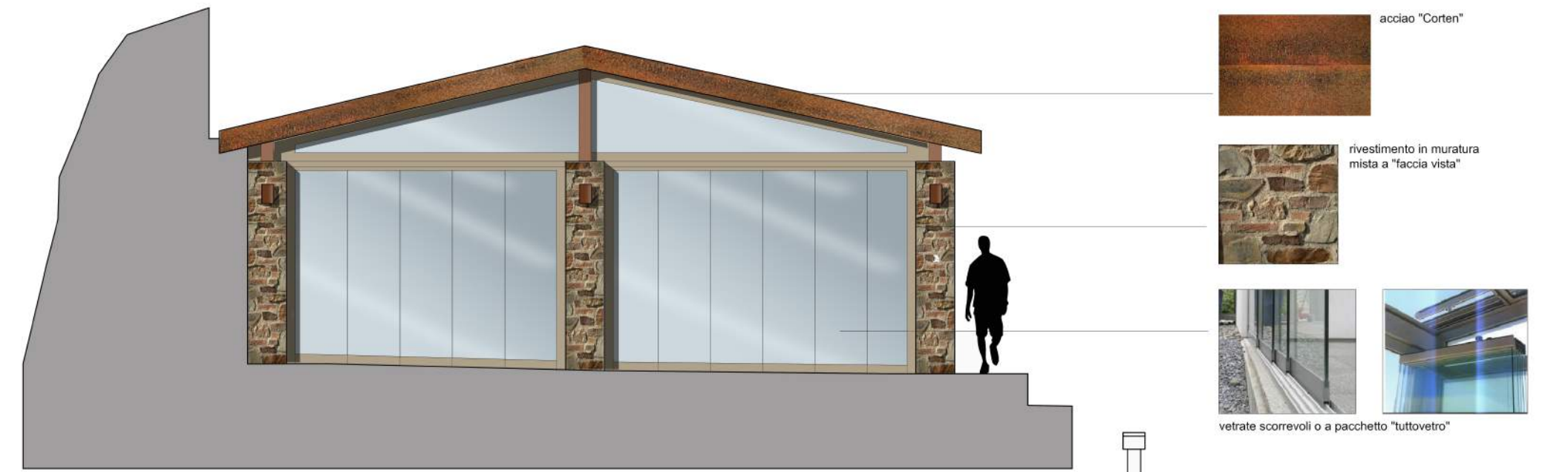
PROSPETTO SUD scala 1:50