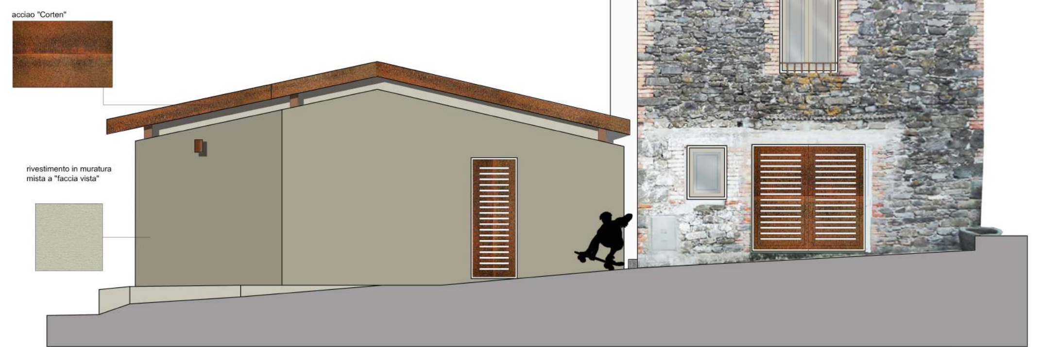
PROSPETTO NORD scala 1:50